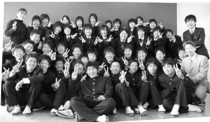
平成21年2月 会計科2年生 全員合格 (現3年生)