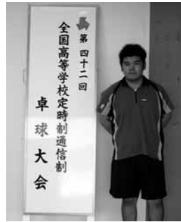
第四十二回 全国高等学校定時制通信制 卓球大会