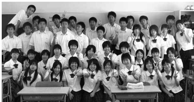
平成20年6月 会計科3年生 全員合格

全国の合格率が12人/40人中のところを、本校では40人/40人中合格というすばらしい結果です！